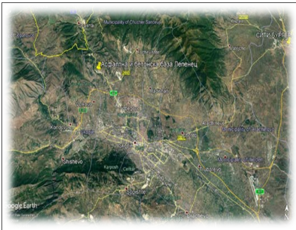
Слика 2. Мапа на локацијата со географска положба и јасно назначени граници на инсталацијата